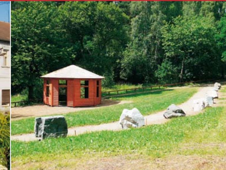
Geologická expozice hornin Podblanicka Český svaz ochránců přírody Vlašim

Expozice se nachází pod Velkým Blaníkem v blízkosti parkoviště nad obcí Kondrac. Návštěvníci se v ní mohou seznámit s geologickou minulostí Podblanicka a využitím přírodního bohatství (lomy, doly). Naleznou zde rovněž 21 vzorků hornin z okolních lomů spolu s popisem jejich složení. Expozice je součástí naučné stezky S rytířem na Blaník, která vede přes vrchol Velkého Blaníku k Louňovicím pod Blaníkem.