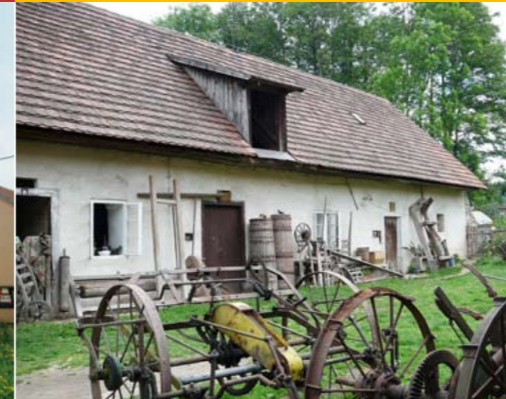
Domácí muzeum v Milovanicích

Cílem aktivit tohoto muzea je zachránit a uchovat co nejvíce předmětů, které doprovázely každodenní život venkovských lidí. Vystavené předměty pocházejí především z Benešovska, poněkud pak z Milovanic, Postupic a blízkého okolí. Je zde představena zařízená venkovská světnice s kuchyňským koutem a náčiním, nářadí a nástroje sloužící ke zpracování zemědělských produktů, dílna s nářadím různých řemesel, množství zemědělského nářadí a strojů i některé kuriozity. Většina předmětů dokumentuje život venkova první poloviny 20. století.