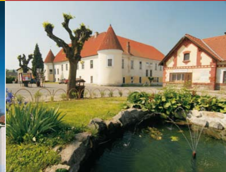
Muzeum Louňovice pod Blaníkem