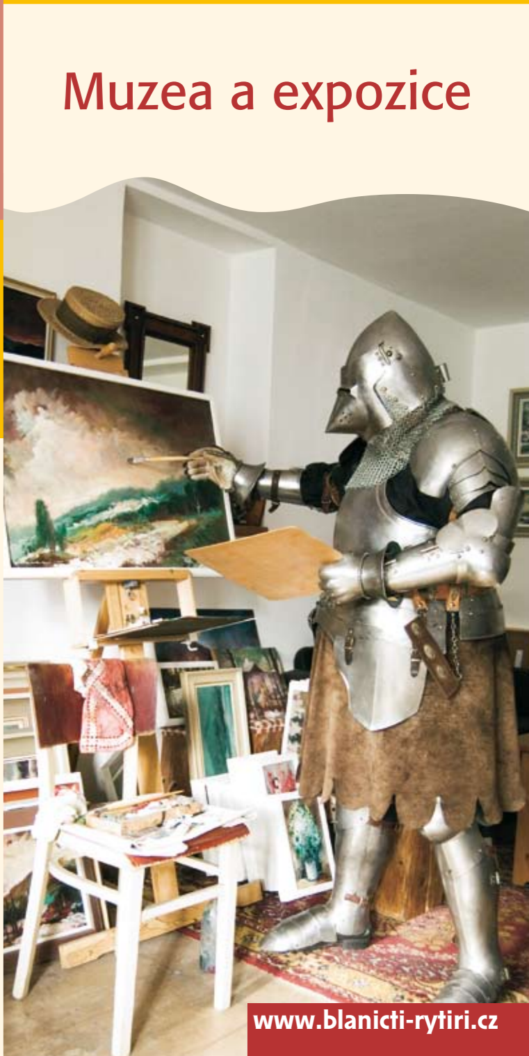
Vyrobena v roce 2010 | text: Mgr. Radovan Čáder a archiv

Na projektu spolupracují město Vlašim, Mikroregion Český smaragd, městysy Čechtice, Křivšourov, Louňovice pod Blaníkem a obce Kamberk, Kondrac, Načeradec, Pravonín, Ratměřice a Veliš.