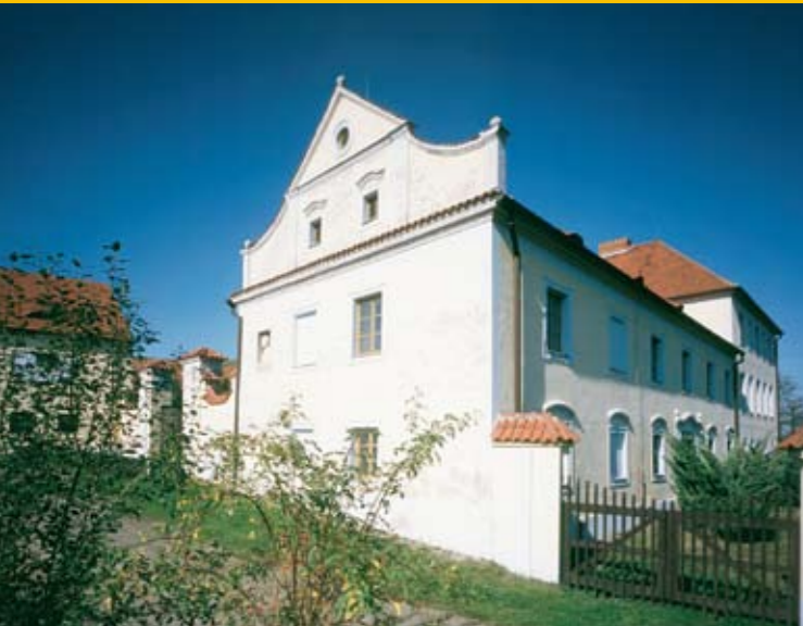
Růžkovy Lhotice Muzeum Podblanicka

Pobočka Muzea Podblanicka v Růžkových Lhoticích sídlí ve zdejší barokní zámku, který byl postaven na místě původní tvrze Oneše Tluksy ze Lhotic ze 14. století a dodnes tvoří dominantu malebné vsíky.