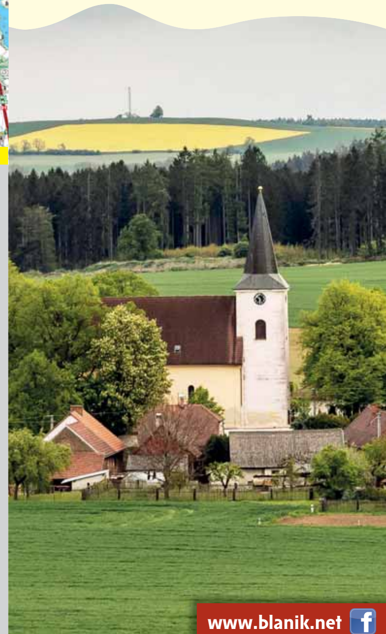
Vyrobeno v roce 2019 | grafická úprava: Viktor Pucí