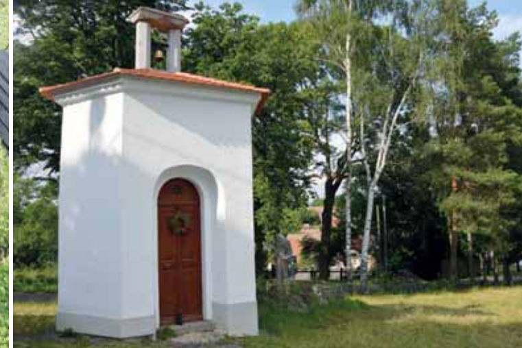
Kaplička v Křenovičkách