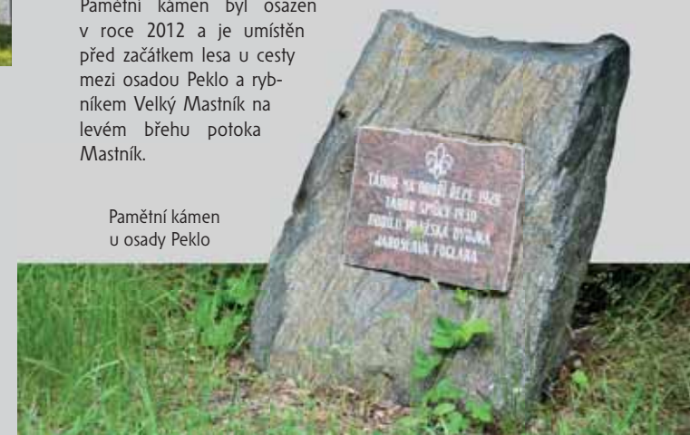
Pamětní kámen u osady Peklo

Pamětní kámen připomíná uskutečnění dvou letních táborů oddílu Pražská Dvojka, které v údolí proběhly v letech 1929 a 1930. Zážitky z těchto táborů popsal spisovatel Jaroslav Foglar v knihách „Hoši od Bobří řeky“ a „Tábor smůly“. Pamětní kámen byl osazen v roce 2012 a je umístěn před začátkem lesa u cesty mezi osadou Peklo a rybníkem Velký Mastník na levém břehu potoka Mastník.