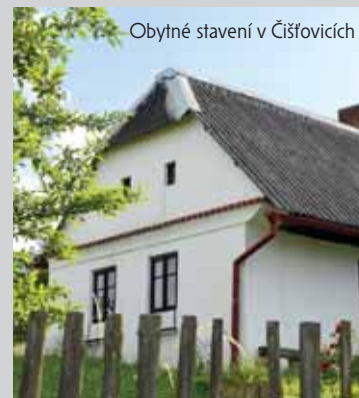
Obytné stavení v Čišřovicích