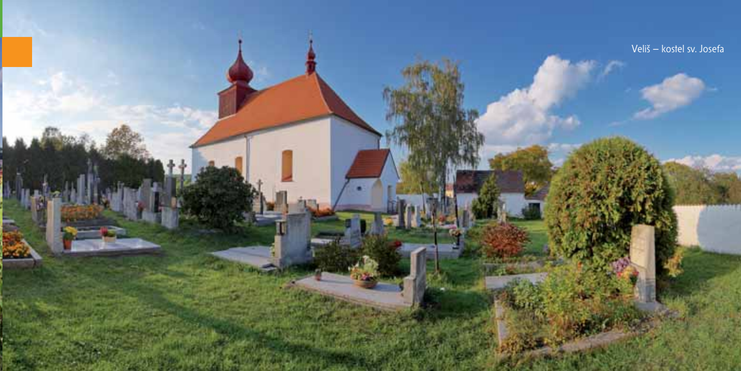
Veliš – kostel sv. Josefa

Rod rytířů z Nesper, který v Nesperách vybudoval tvrz, jejíž pozůstatky se dodnes zachovaly v základech barokního špýcharu tvořícího dominantu této krásné vsí, odprodal své zdejší statky včetně svých majetků ve Veliši na počátku 16. století rodu Chobotských z Ostředka, který vlastnil také vsi Tehov a Chotýšany. Po vymření rodu Chobotských v roce 1680 se v následujících desetiletích střídali ve vlastnictví Nesper a Veliše různí šlechtičtí majitelé až do roku 1693. Tehdy zdejší majetky zakoupil vlastník Vlašimi Helmhard Kryštof hrabě z Weisenwolfu a připojil je k vlašimskému panství.