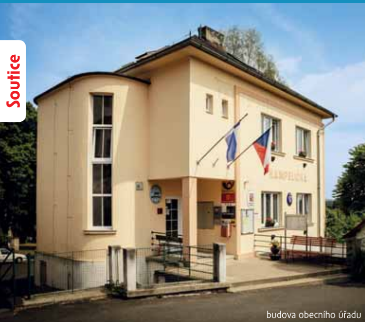
budova obecního úřadu