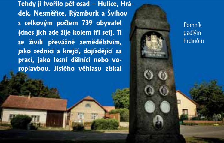
Pomník padlým hrdinům

švihovský mlýn, kde byla v letech 1906–1910 zřízena brusírna dutého skla a kroužků ke stolnímu prádlu, které se vyvážely až do Přední Indie.