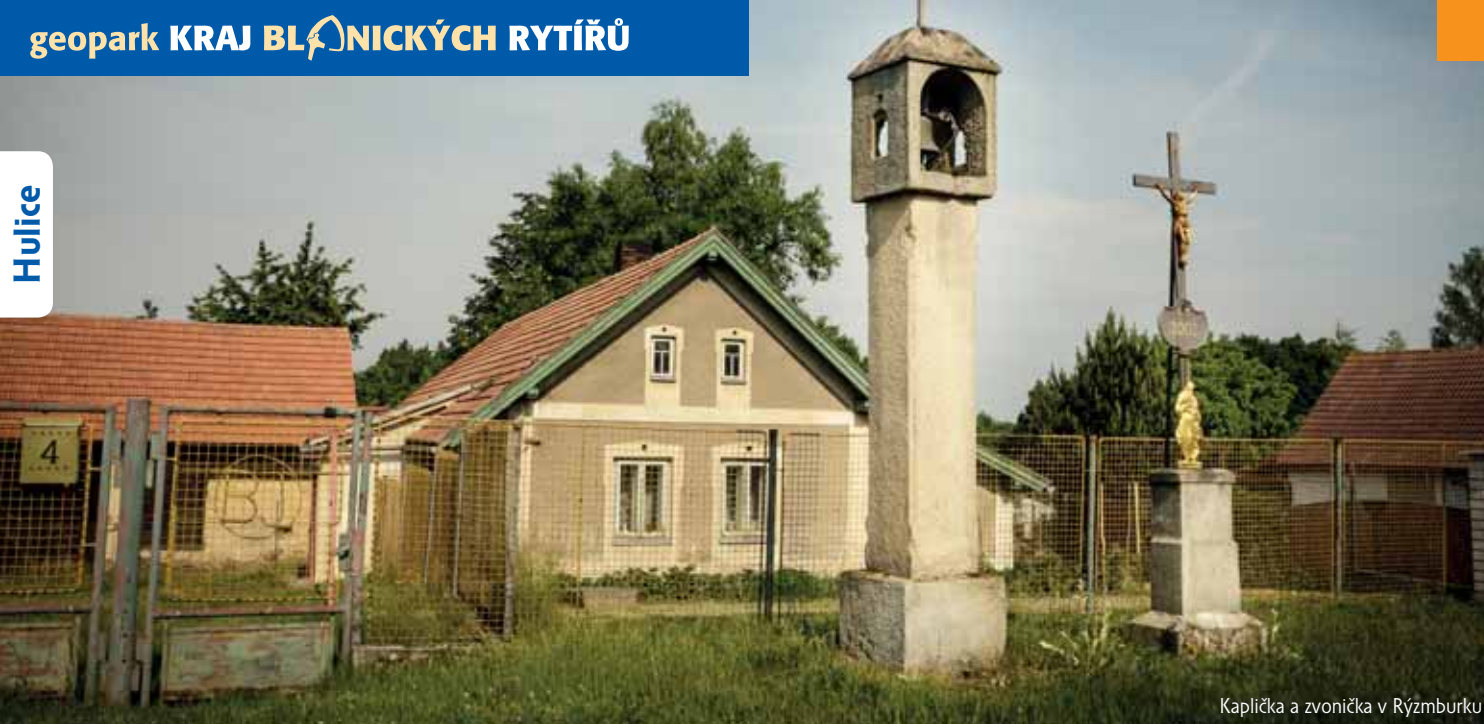
Kaplička a zvonice v Rýzmburku